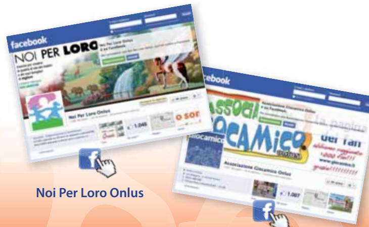
Noi Per Loro Onlus